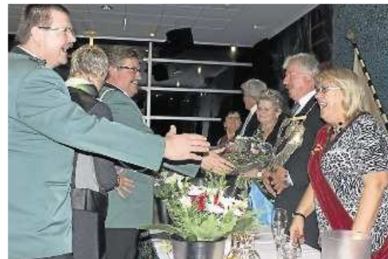
Herzliche Grüße wurden beim Königsball des Schützenvereins Hohe Geist via Handschlag übermittelt.

Königsball des Schützenvereins Hohe Geist